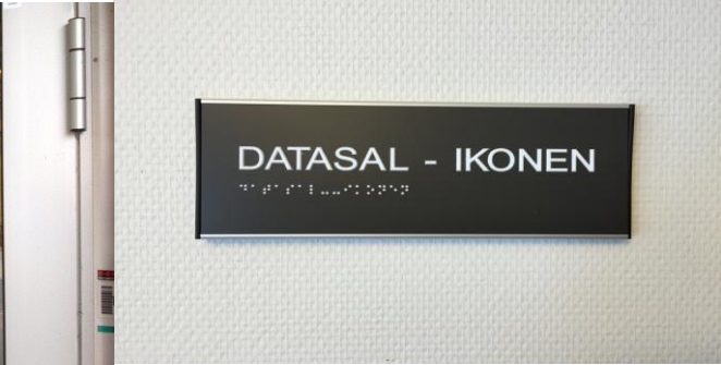
Namnskylt, taktilt och braille.