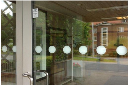
Exempel kontrastmarkering på entré.